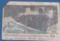
Свобода или смерть 1941-1945