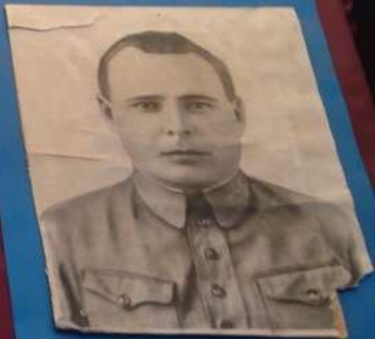
Свобода или смерть 1941-1945