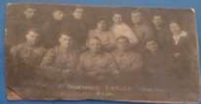
Свобода или смерть 1941-1945